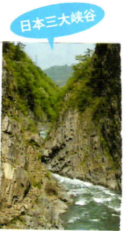
日本三大峡谷 上信越高原国立公園 清津峡 十日町市 [C-7] 清流と柱状節理の岩肌 がおりなす美しいコント ラスト。観光トンネルで は4カ所の見晴所から 一年を通じて眺望を楽し めます。 開 9:00~17:00 ☎ 025-763-4800