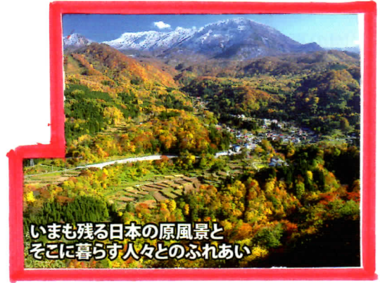
いまでも残る日本の原風景と そこに暮らす人々とのふれあい

※等コースは平家落人伝説の里、秘境「秋山郷」 まで車約2時間です。1日コースです。 特に紅葉シーズンは道路帯が予想されるので、時間 に余裕をもつて行動して下さい。