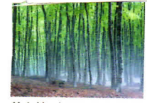
美人林 十日町市 [B-5] 樹 齢約80年のすらりとした ブナが丘陵一面に立ち並 びます。初夏を彩る眩しい 新緑など、春夏秋冬に訪 れる人々を魅了。